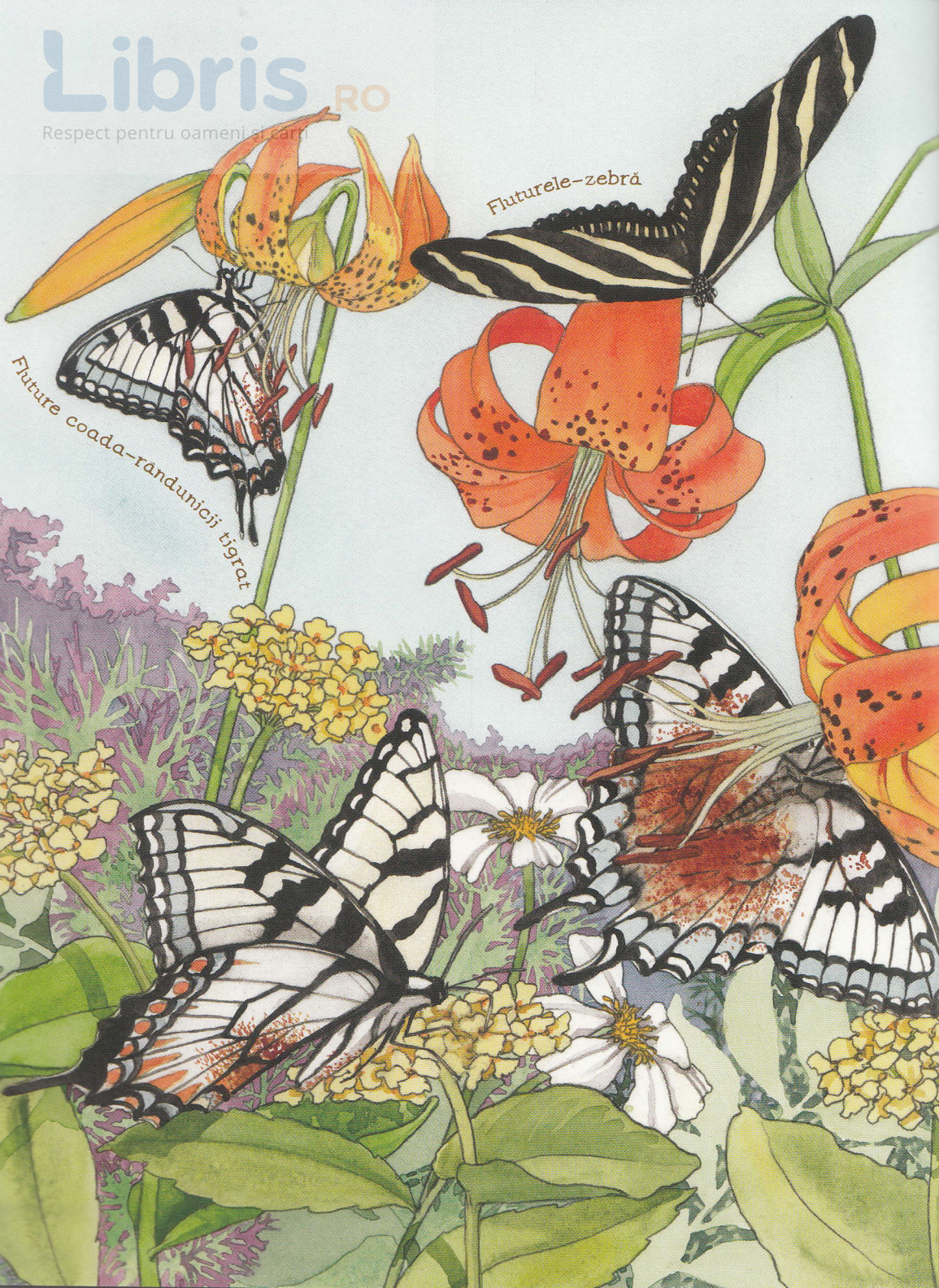
Fluture coadă-rândunicii tigrat